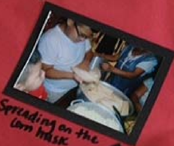
Spreading on the corn husk