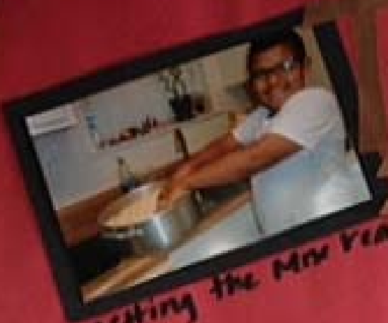
Getting the mix ready