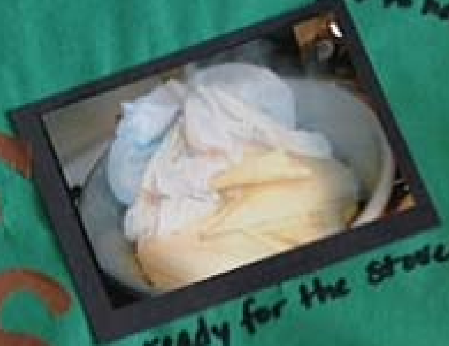
ready for the stove